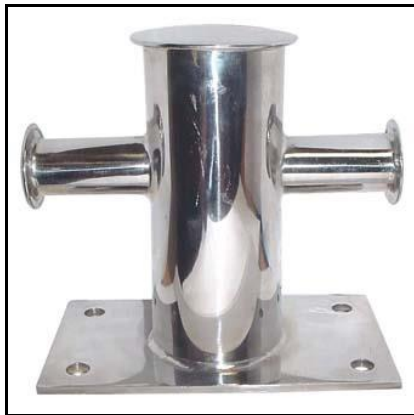
Figura 5 – Exemplo de ponto para amarração de embarcação em aço inox.

Para atracação das embarcações de uso do parque e dos moradores da região, será necessária a instalação de dispositivos para amarração das embarcações, com distância de 2 m, perfazendo-se um total de cinco pontos. Estes pontos deverão ser confeccionados em aço inox, aparafusado em uma base com fundação em armação de concreto, suficiente para suportar o esforço de embarcações de pequeno porte.