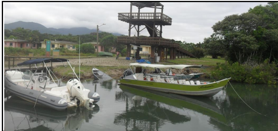
Figura 2 - Fotos do local a ser recuperado.

Por estes fatores acima e outros, houve o escorregamento da margem do rio, deixando o atracadouro do PEIC em péssimas condições, outro fator que preocupa é a posição do mirante, que por estar muito próxima a margem e com a preocupação de aumento do deslizamento podem comprometer as fundações do mirante.