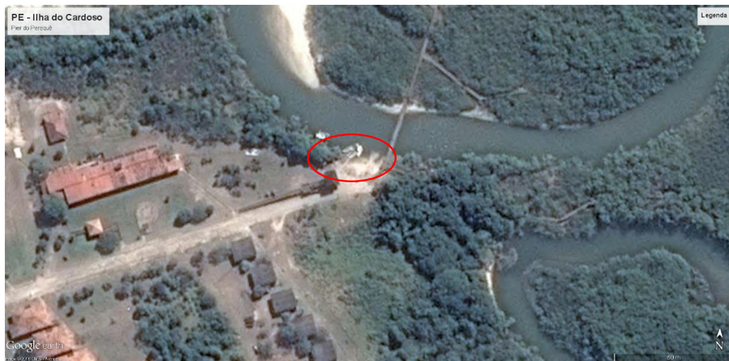
Figura 1 – Localização dos serviços de contenção via satélite.

Localização Geográfica das obras de drenagem de transposição de talvegues: UTM Zona 23 J, Longitude 205529.66 m E, Latitude 7224275.54 m S.