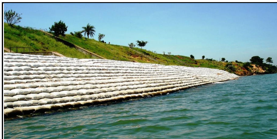
Figura 3 - Exemplo de recuperação de margem de rio com bolsas de cimento-solo (Rip-Rap).

Para esta obra optou-se no assentamento de geoforma têxtil de concreto ensacado que denominamos de “Rip-Rap” por sua semelhança ao dispositivo com esse nome utilizado em obras de barragens, por serem fáceis de transportar, são bolsas transformadas de areia e cimento em grandes blocos de pedra para obras de Engenharia Hidrogeotécnica, sem desvio de água, sem ensecadeira e sem esgotamento, são construídas “in loco” uma vez que padras de mão e peças de concreto pré-moldadas seriam opções muito onerosas para o transporte e para seu assentamento.