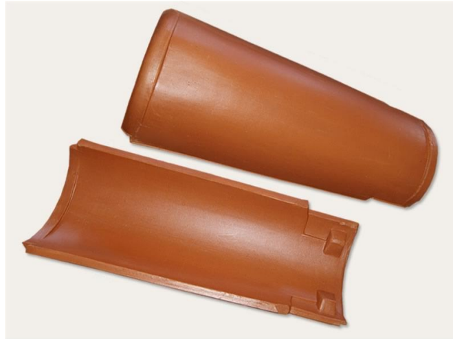
Imagem 03 – Exemplo de Telha tipo Colonial