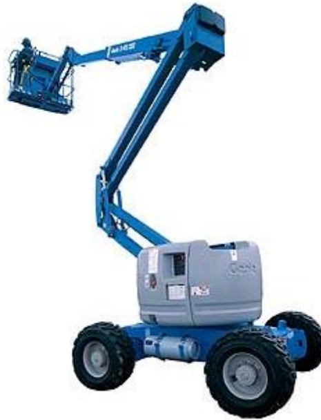
Imagem 02 – Exemplo de Plataforma Elevatória Articulada