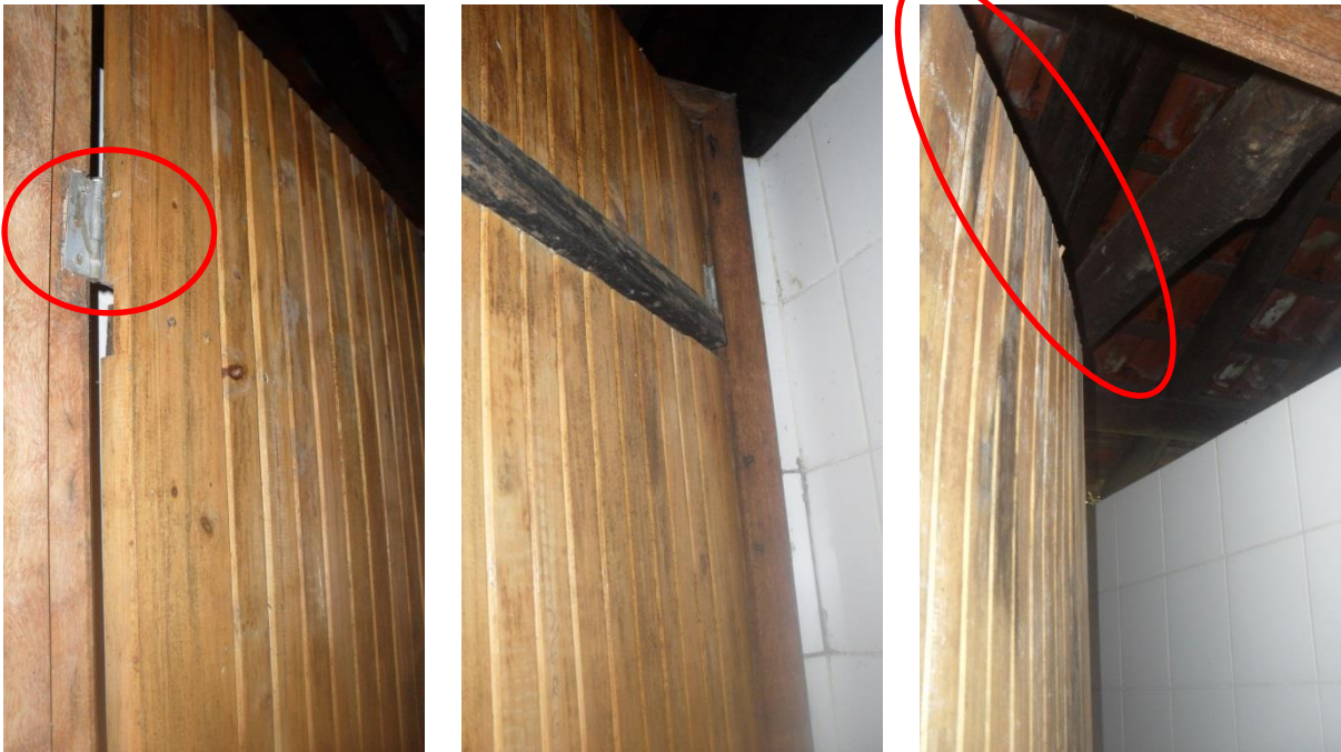
Fotos 15, 16 e 17 – Portas confeccionadas de soalho, empenadas e frágeis.

As portas dos boxes são confeccionadas com madeira de soalho e travessas internas. Estas peças oferecem pouca resistência e facilidade para empenamentos e outras retrações, as dobradiças utilizadas também são frágeis, inadequadas para portas. As fotos 15 a 17 ilustram a situação.