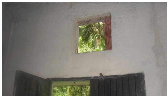
Foto 14– Necessidade de esquadria com tela metálica em outro vão aberto