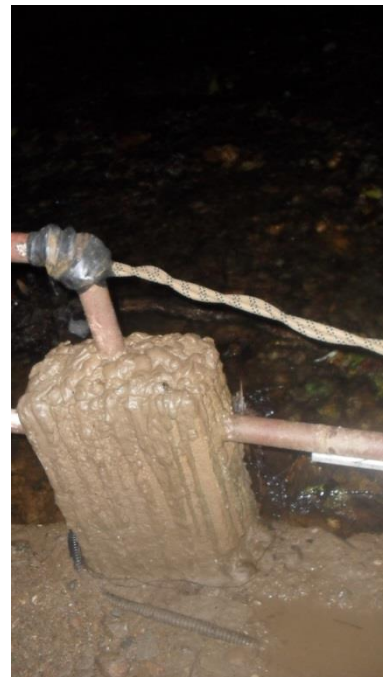
Fotos 30 e 31 – Improvisação com corda na ausência de parte do guarda-corpo