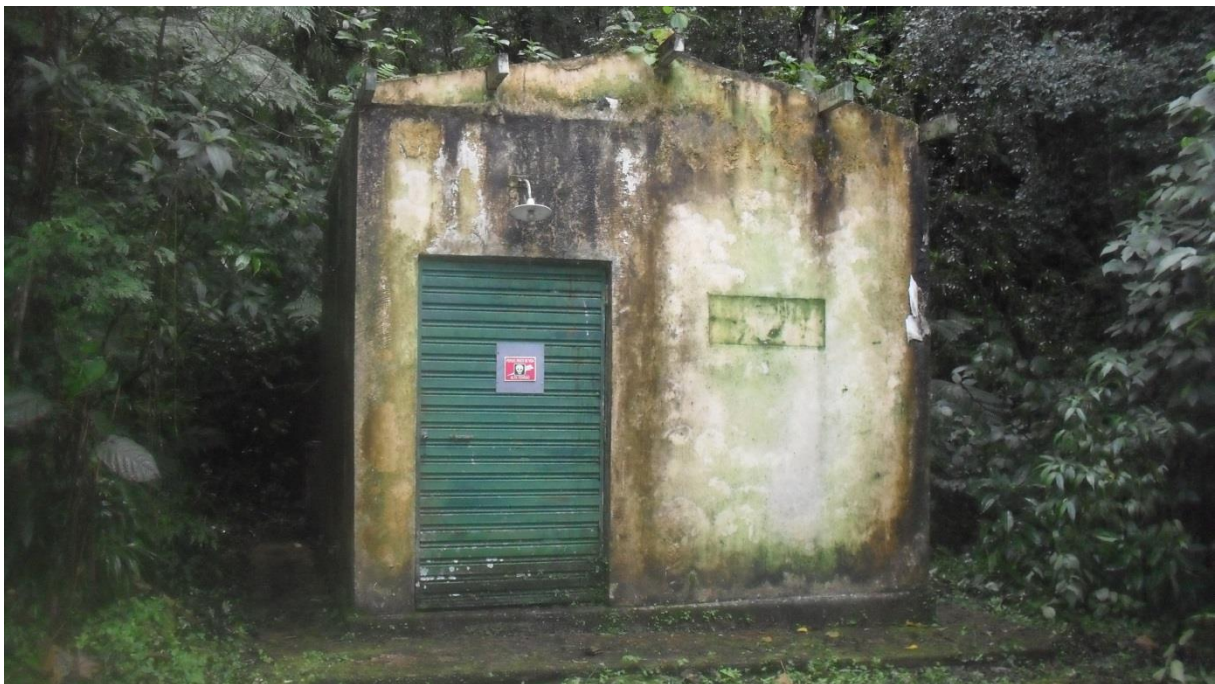
Foto 1 - Fachada Principal Casa do Transformador

Trata-se de local destinado ao alojamento do transformador para rebaixamento de tensão e alimentação de energia para iluminação da caverna com energia fornecida pela concessionária.