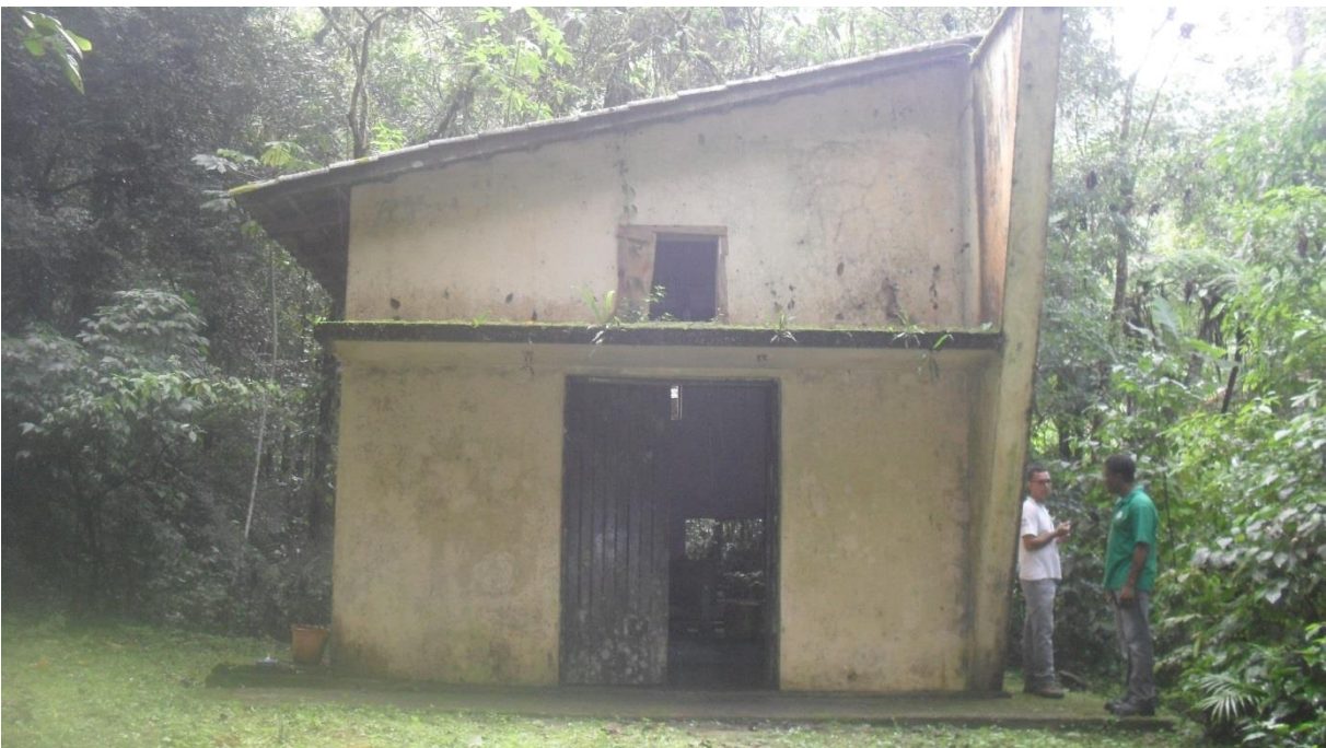
Foto 6 - Fachada Principal Casa dos Geradores

Trata-se de local destinado ao alojamento dos geradores a diesel para alimentação de energia da iluminação da caverna quando ocorre falta de energia fornecida pela concessionária.