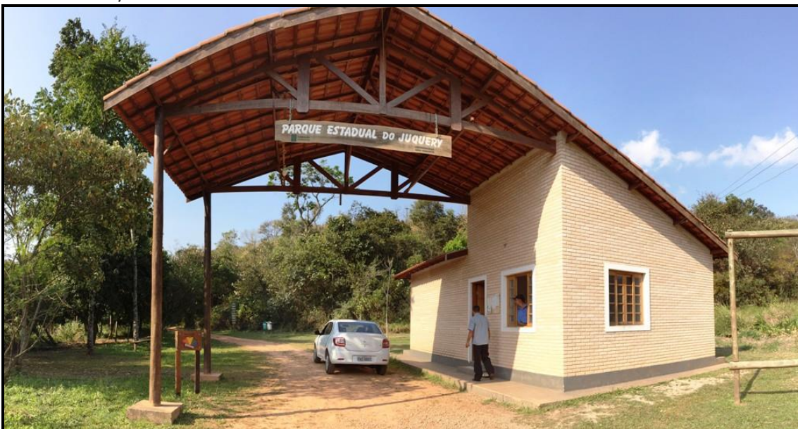
Figura 1 – Entrada do PE Juquery, guarita 2.

Contratação de serviços de troca de padrão de entrada de energia elétrica no PEJ – PARQUE ESTADUAL JUQUERY, situado na Rod. Prefeito Luiz Salomão Chamma, 1.800, Vila Ramos, 07858-600 Franco da Rocha.