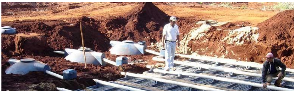
Figura 1 – Exemplo de ETE Compacta.

determinação direta da DBO, admite-se para essa grandeza o valor de 54g/hab/dia na elaboração do projeto de uma estação de tratamento de esgotos.