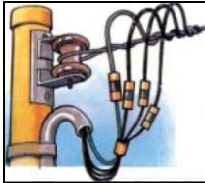
Figura 7 – Entrada de fiação para caixa de medição.

Os eletrodutos deverão ser do tipo de PVC rígido, com diâmetro apropriado, deverão ser fixados conforme orientação do fabricante com seus respectivos acessórios.