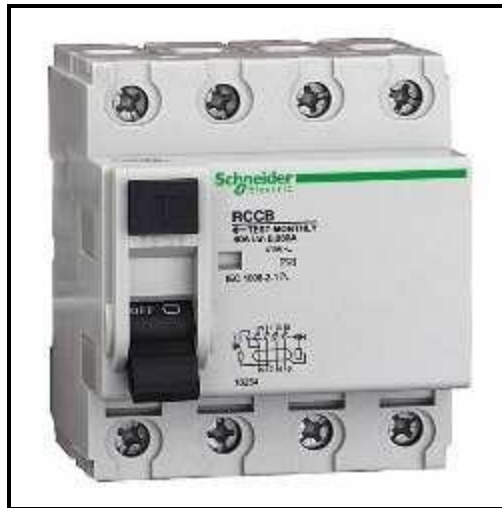
Figura 3 – Dispositivo DR para ligação FFFN.