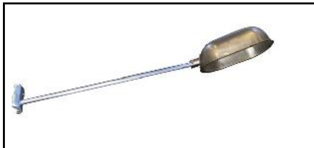
Figura 8 – Luminárias com lâmpadas de vapor metálico de 150W.

Deverão ser do tipo iluminação pública com haste em metal e corpo em alumínio, com lâmpadas de vapor metálico e relé fotovoltaico de acionamento individual.