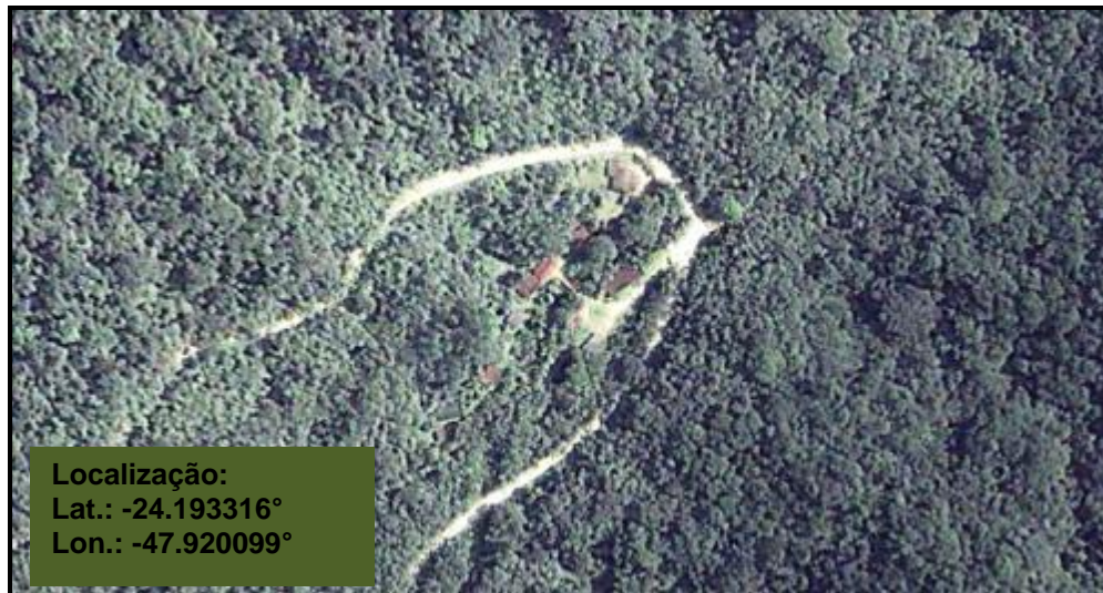
Figura 1 - Localização do PECB-NSB via satélite.

Contratação de serviços de reforma nas Instalações Elétricas de Baixa Tensão no PECB-NSB – PARQUE ESTADUAL DE CARLOS BOTELHO, NÚCLEO SETE BARRAS localizado no município de Sete Barras.