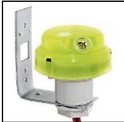
Figura 9 – Relé fotoelétrico para acionamento das luminárias externas.