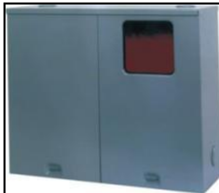
Figura 6 – Caixa de entrada padrão.

A caixa de entrada deverá seguir o padrão da concessionária Elektro ( www.elektro.com.br ), na figura abaixo.