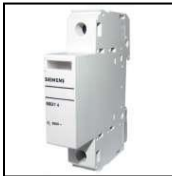
Figura 2 – Dispositivo de Proteção de Surto – DPS.

Na caixa de medição, deverá ser instalado juntamente com os disjuntores, dispositivos proteção de descarga e surto atmosférico (DPS), conforme visto na Figura 2 abaixo.