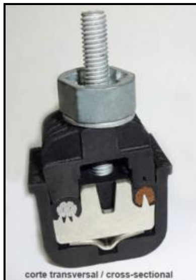
Figura 5 – Conectores de derivação perfurantes.

As derivações das fiações deverão ser feitas através de conectores de derivação perfurantes.