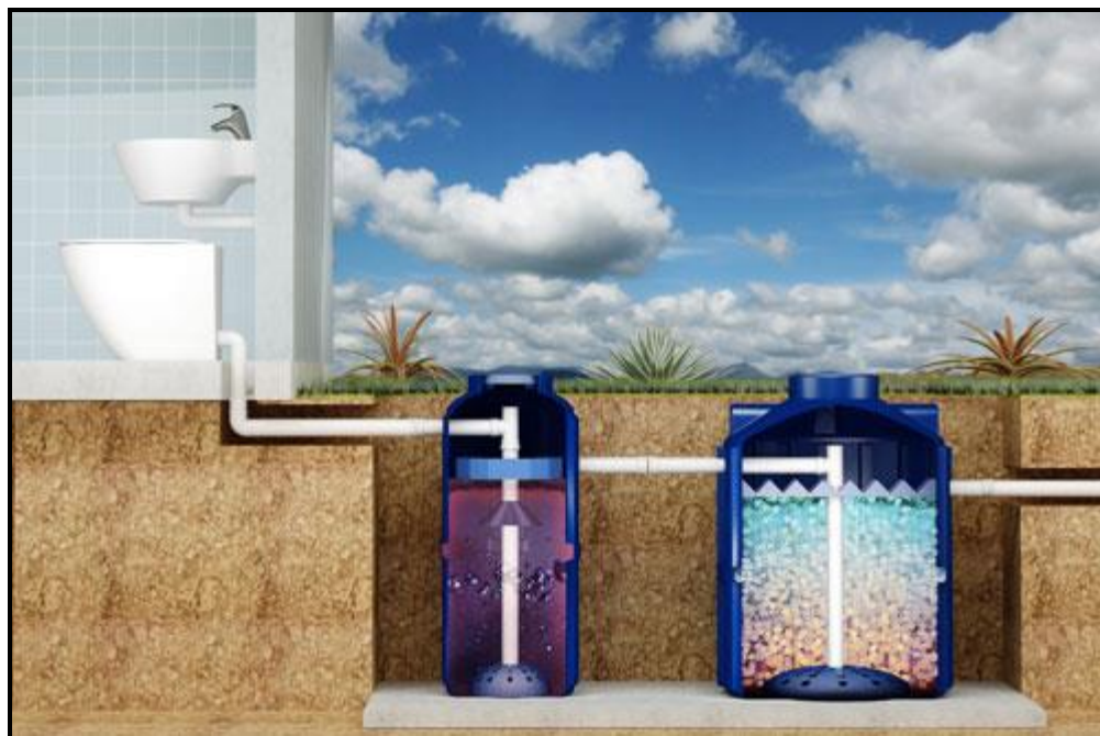
Figura 2 – Exemplo de ETE Compacta.