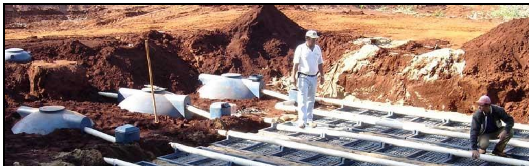
Figura 1 – Exemplo de ETE Compacta.

Para as instalações do parque foi adotado o sistema de ETE Compactas. Seu funcionamento deverá conter as seguintes características e funcionalidades: