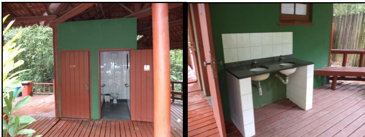
Figura 6 – Detalhe dos sanitários e lavatório público.