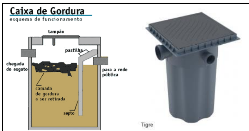
Figura 3 – Exemplo de caixa de gordura.