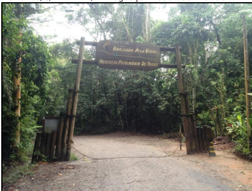
Figura 7 - Local da obra.

Estrada dos Castelhanos, s/nº - km 2,2 – Itaguaçu 11630-000 Ilhabela.