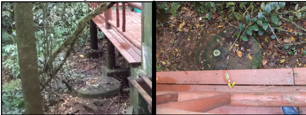
Figura 5 – Local da fossa atual.

Deverá ser desativada seguindo normas técnicas da ABNT.