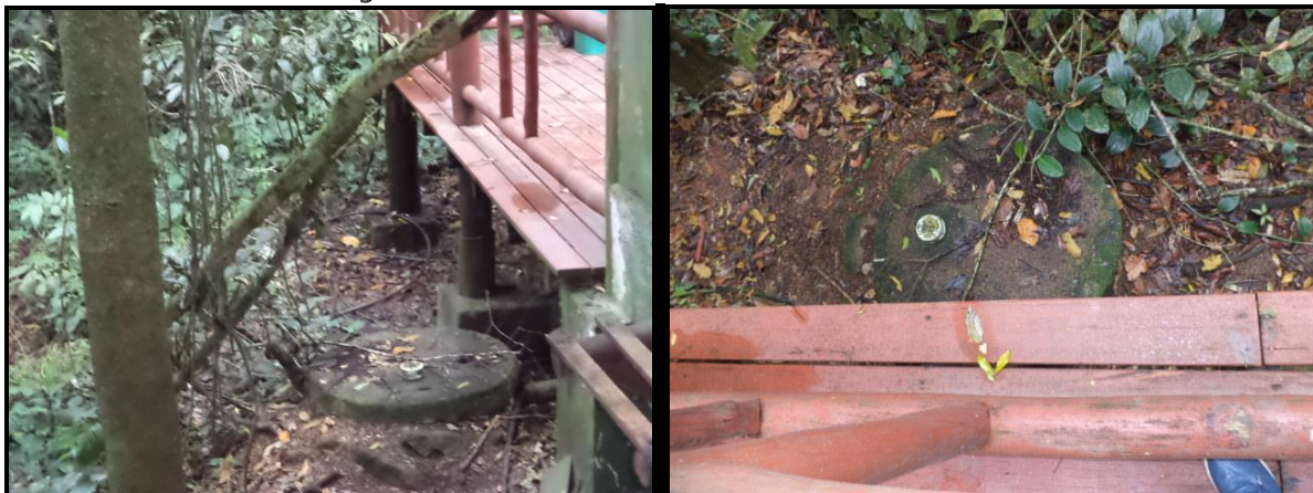
Figura 5 – Local da fossa atual.

Deverá ser desativada seguindo normas técnicas da ABNT.