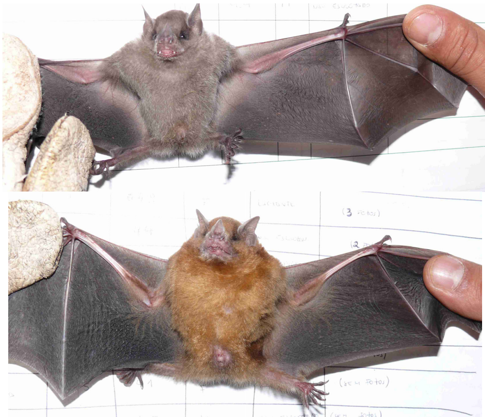
Foto 4: Sturnira lilium capturadas na Gleba I. Foto de cima, indivíduo em estágio não reprodutivo. Foto de baixo, indivíduo em estágio reprodutivo.