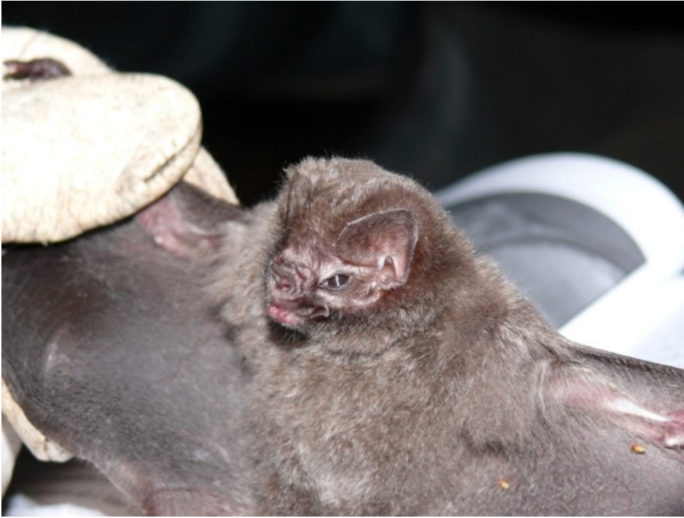
Foto 1: Diphylla ecaudata espécie de morcego na categoria vulnerável no estado de São Paulo, registrada na Gleba 2 e entorno.