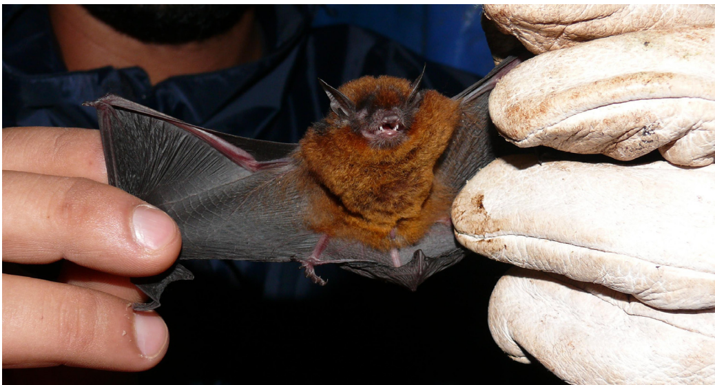
Foto 2: Myotis ruber espécie ameaçada na categoria vulnerável para o Brasil, registrada na Gleba 1 e no entorno.