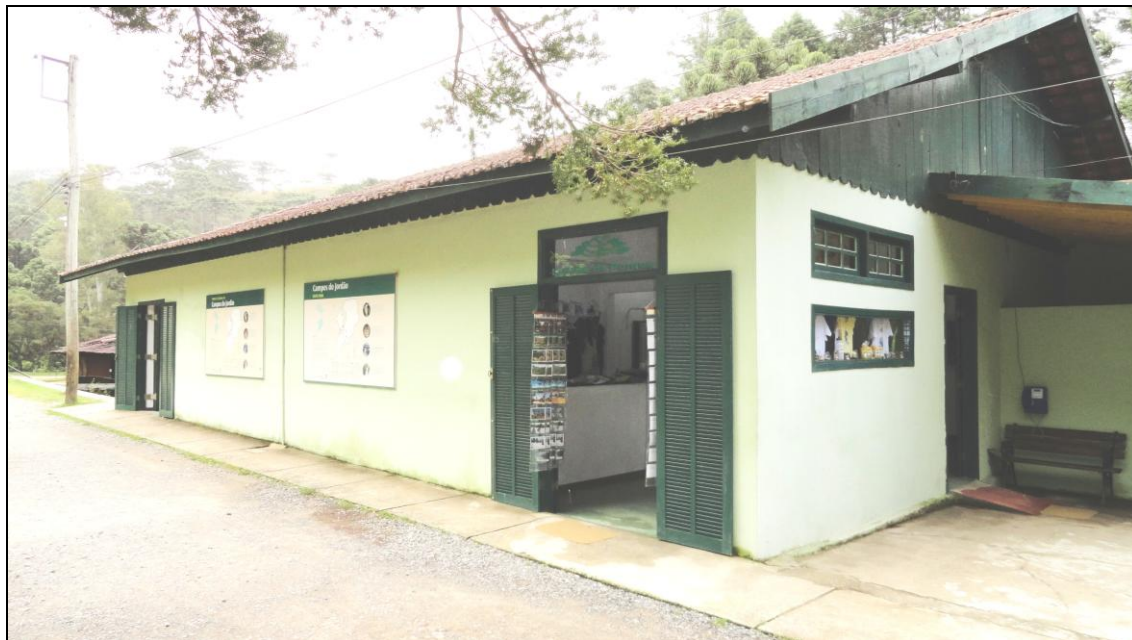
Foto 01. Imóvel destinado à loja de souvenirs.

O imóvel está localizado na área de uso público do Parque Estadual Campos do Jordão anexo ao prédio do Centro de Visitantes. A edificação possui uma área de 28,11 m 2 e pé-direito de 2,83 m, sendo composto por um salão em alvenaria, com piso de cimento queimado e teto em madeira, conforme planta de arquitetura constante no anexo I. Apresenta espaço para exposição de produtos, balcão e depósito.