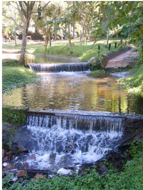
Figura 41 – Recanto das Águas