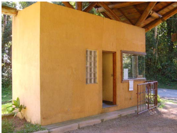
Figura 14 e 15 – Bilheteria