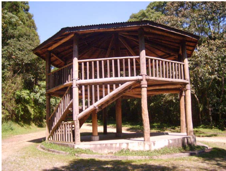
Figura 22 - Quiosque