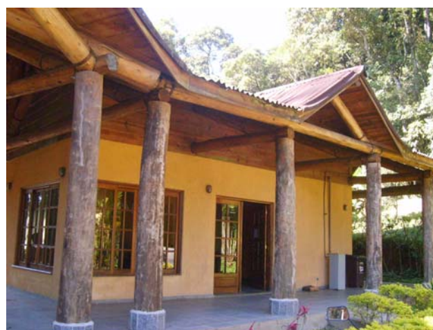
Figura 16 e 17 – Casa de Vigilância