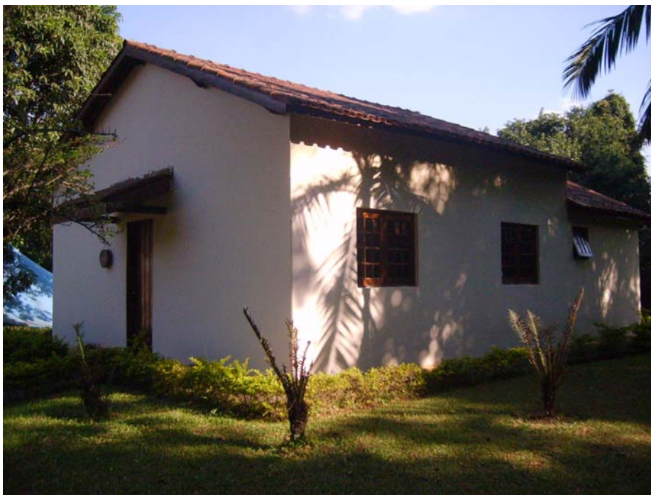
Figura 8 – Audiovisual