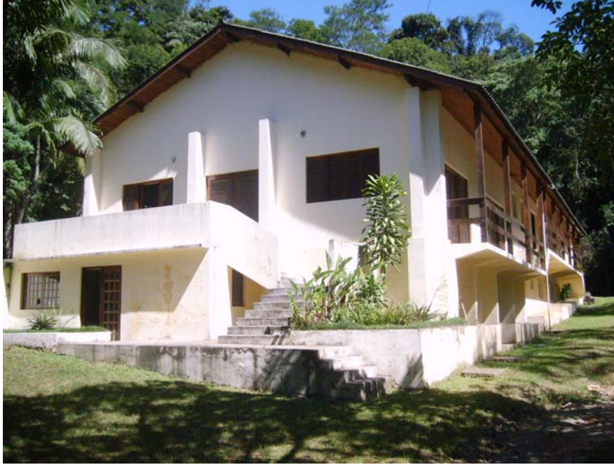
Figura 2 – Administração