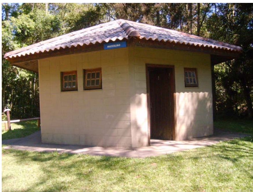
Figura 23 – Sanitário Lago das Carpas