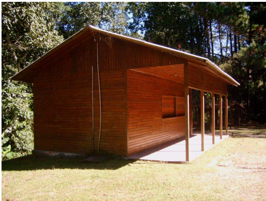
Figura 36 – Brinquedoteca