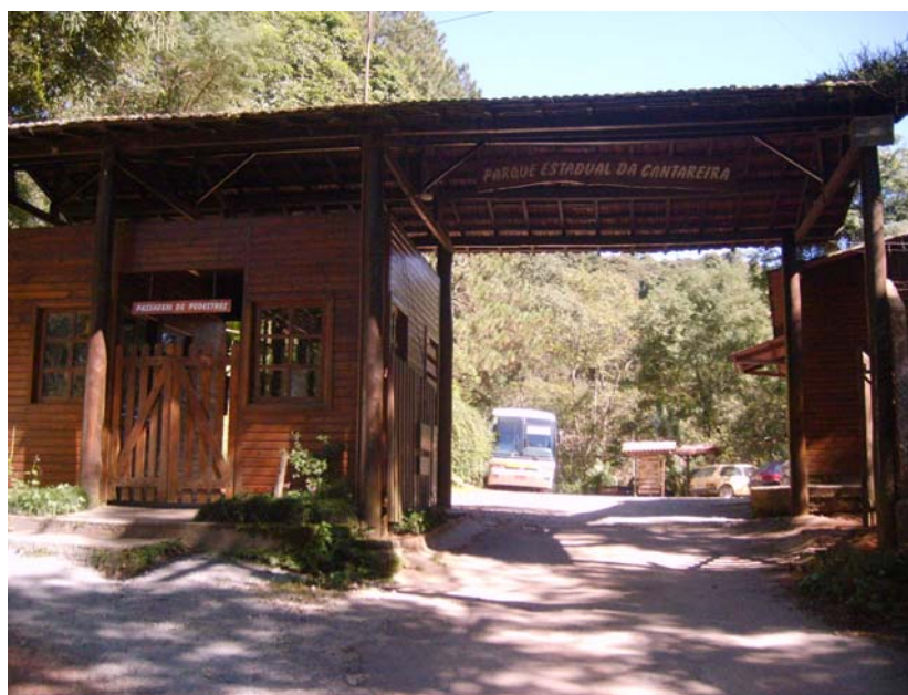
Figura 27 – Portaria