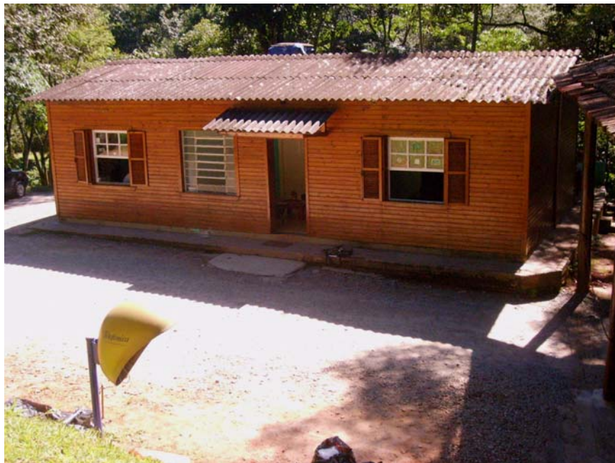
Figura 28 – Portaria