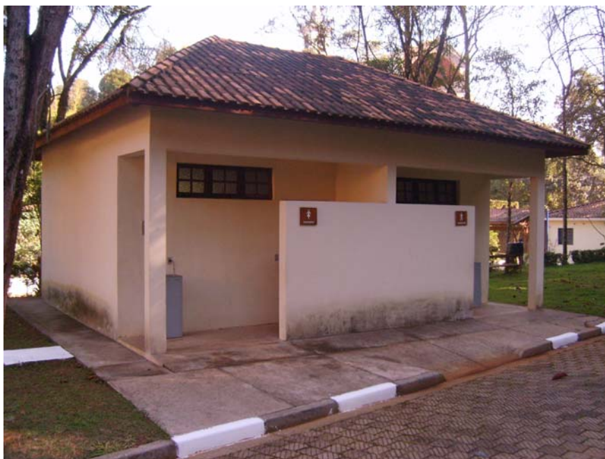
Figura 49 – Sanitários