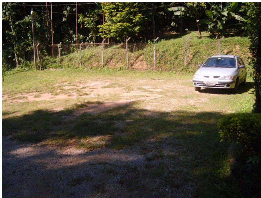
Figura 13 – Estacionamento