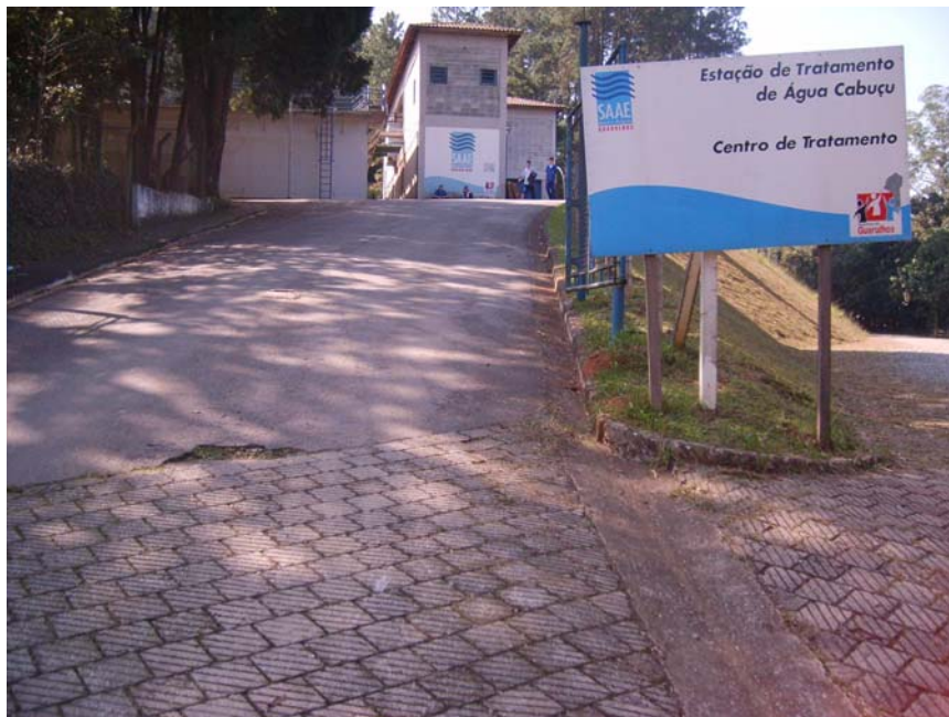
Figura 53 – ETA