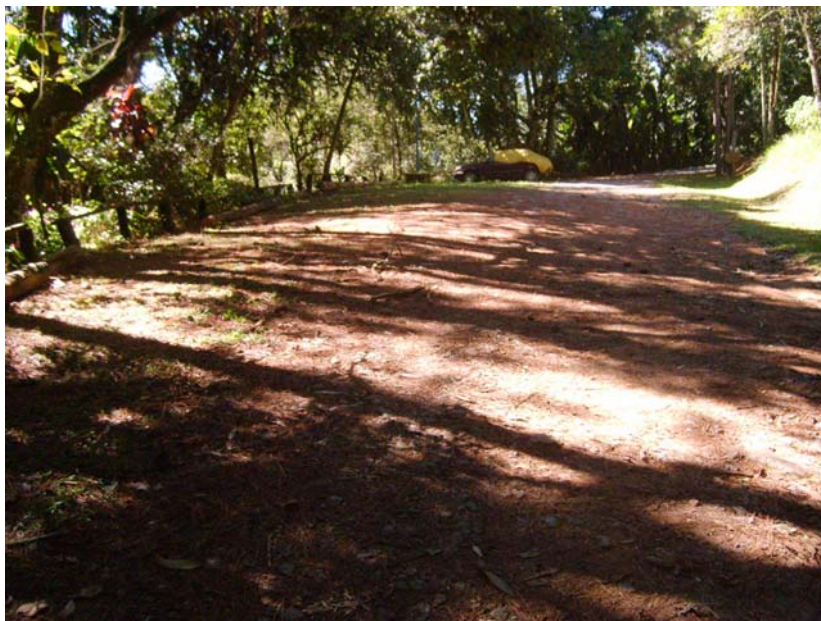
Figura 26 – Estacionamento