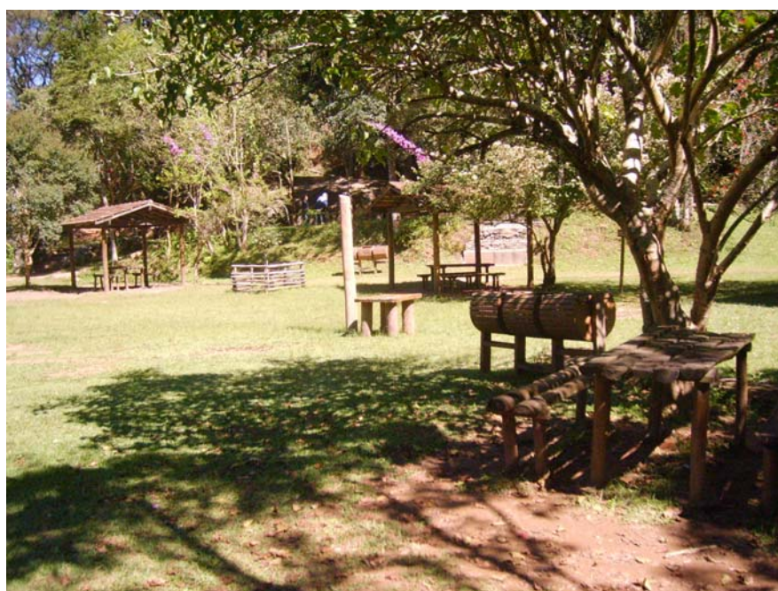
Figura 39 – Área de Piquenique