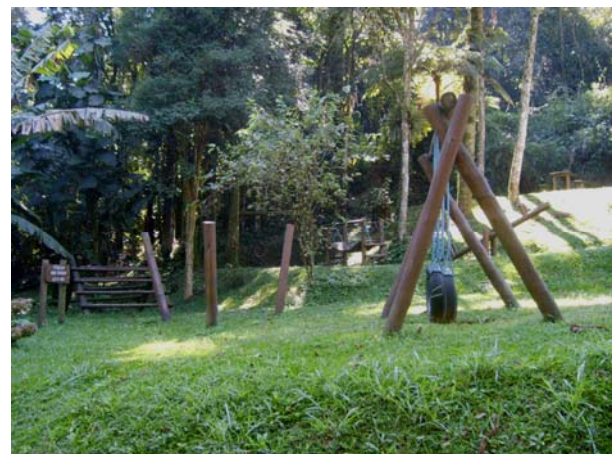
Figura 20 e 21 – Playground