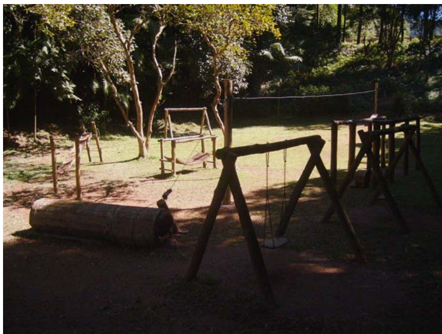
Figura 38 – Playground