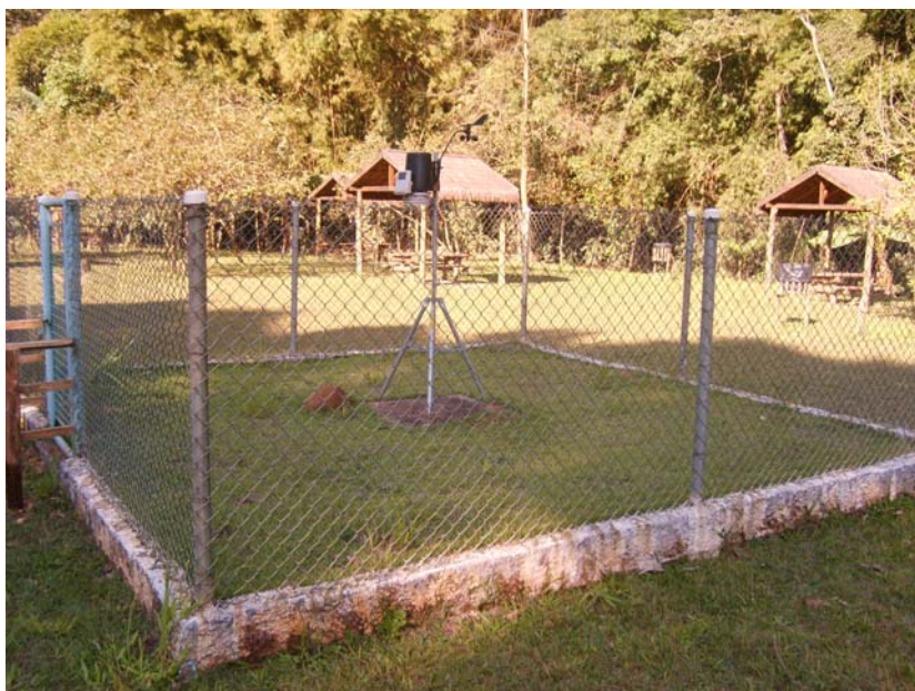
Figura 55 – Estação Meteorológica