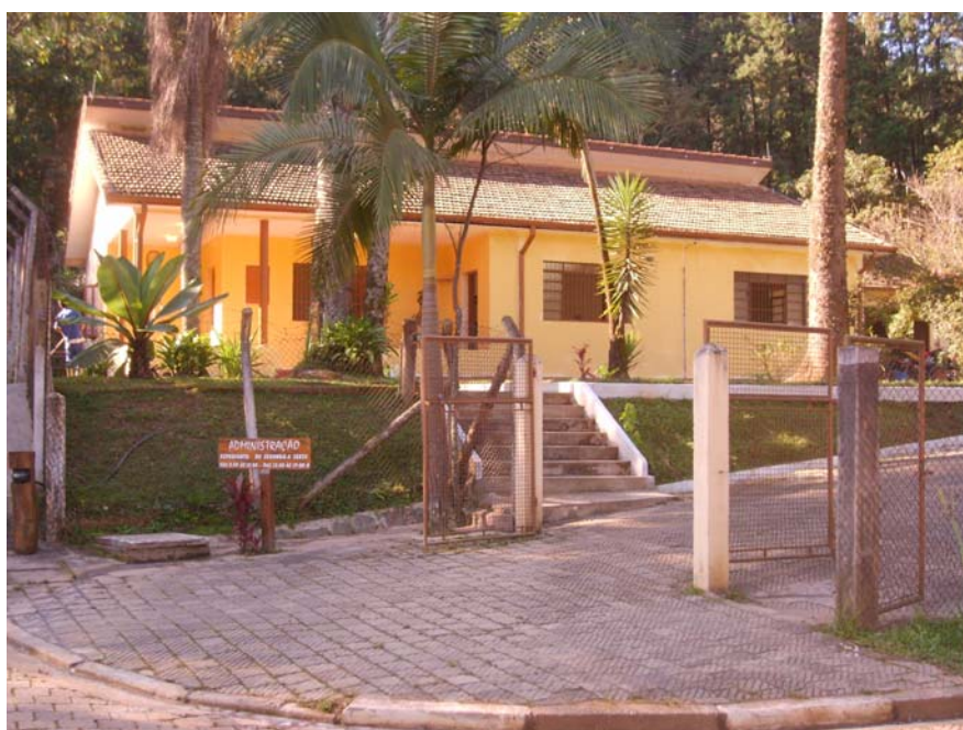
Figura 44 – Administração