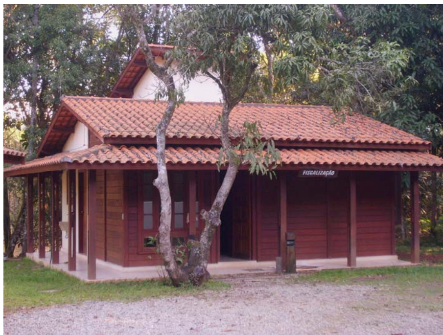
Figura 46 – Setor de Vigilância