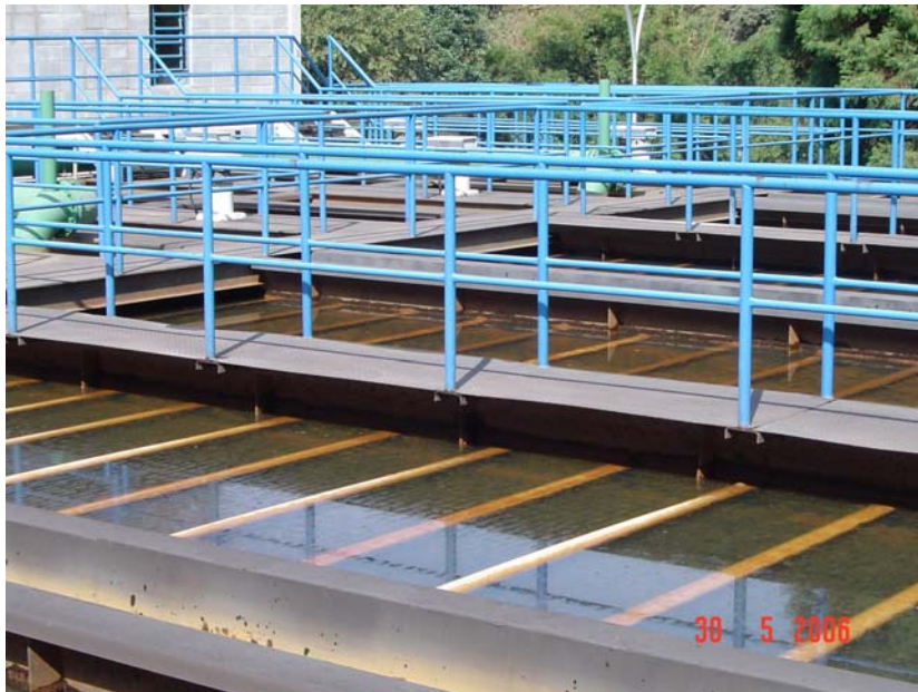
Figura 54 – ETA