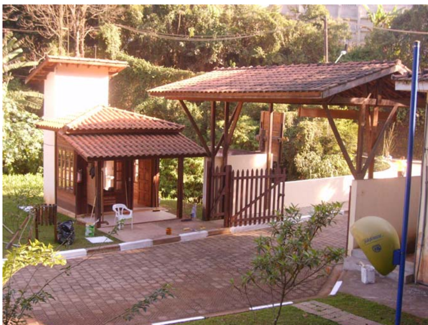
Figura 43 – Portaria