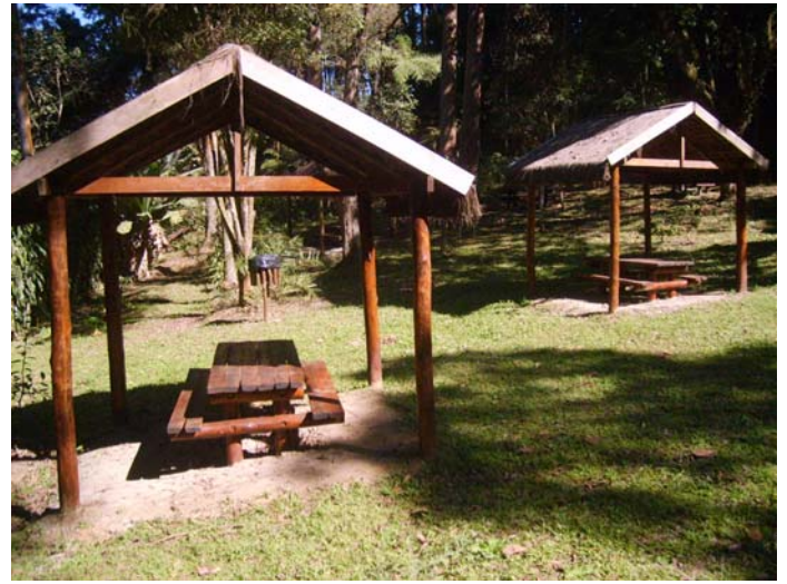
Figura 51 e 52 – Área de Piquenique