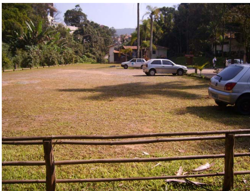
Figura 42 – Estacionamento