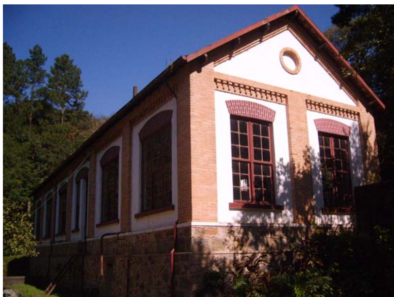
Figura 33 – Casa da Bomba