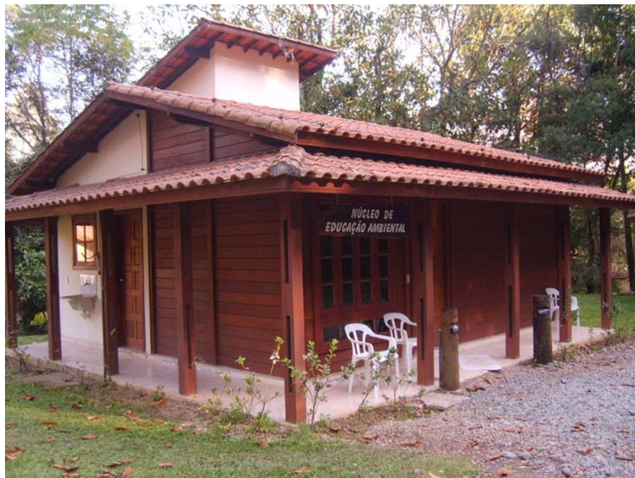
Figura 47 – Núcleo de Educação Ambiental