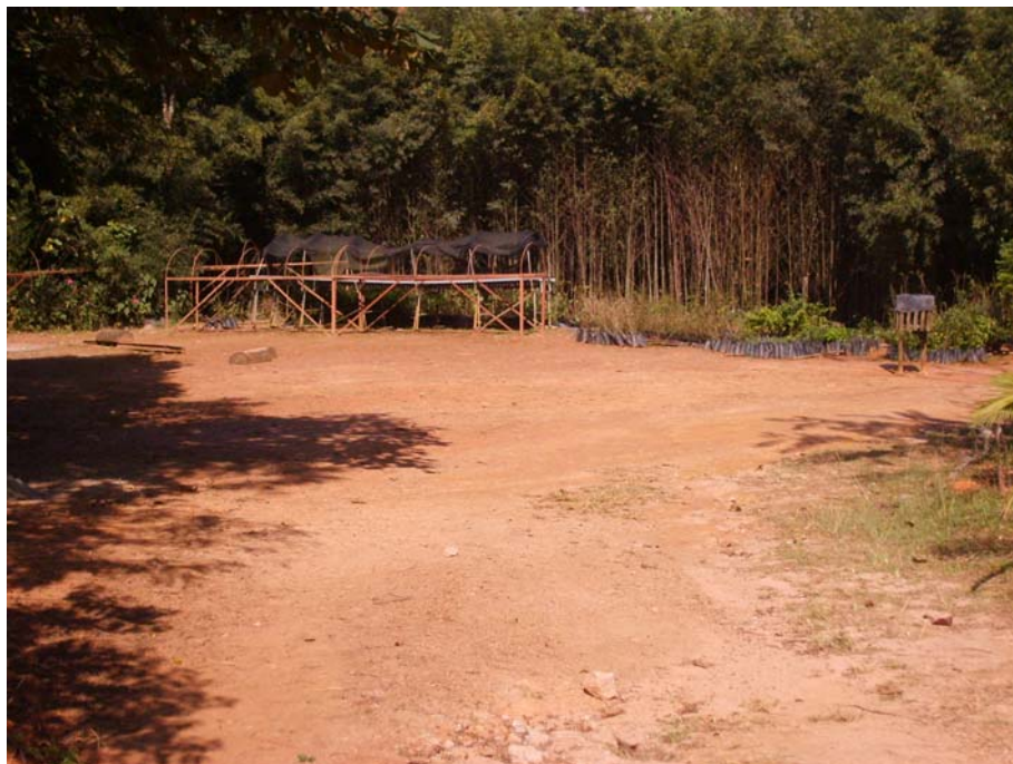
Figura 48 – Viveiro de Mudas