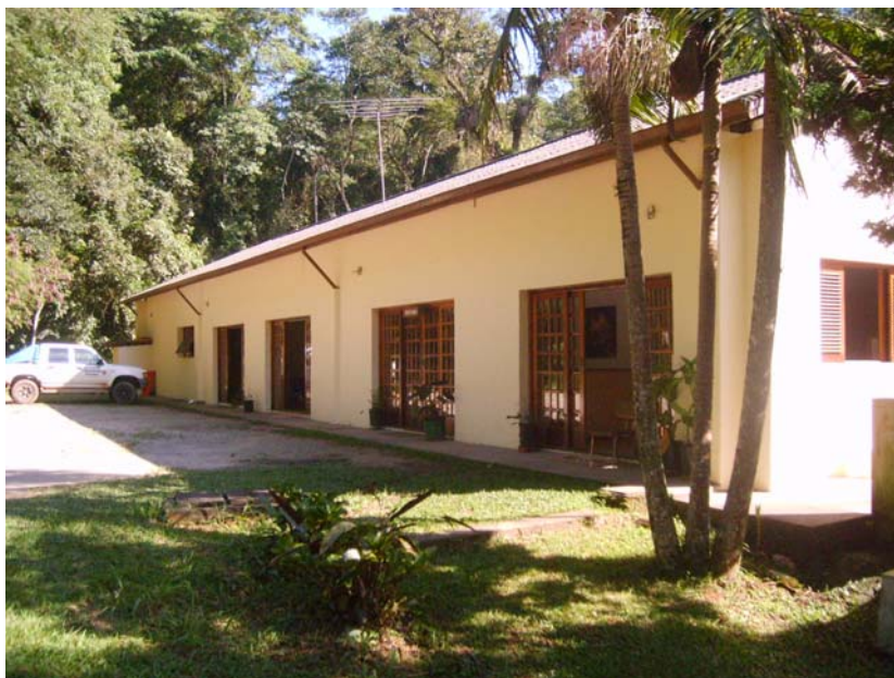
Figura I – Administração