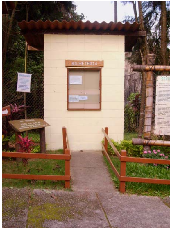
Figura 4 – Bilheteria