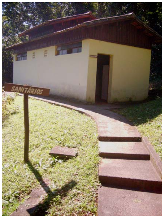
Figura 12 – Sanitário Pedra Grande