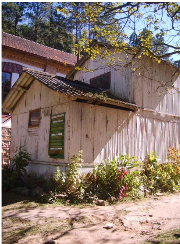
Figura 34 – Manutenção