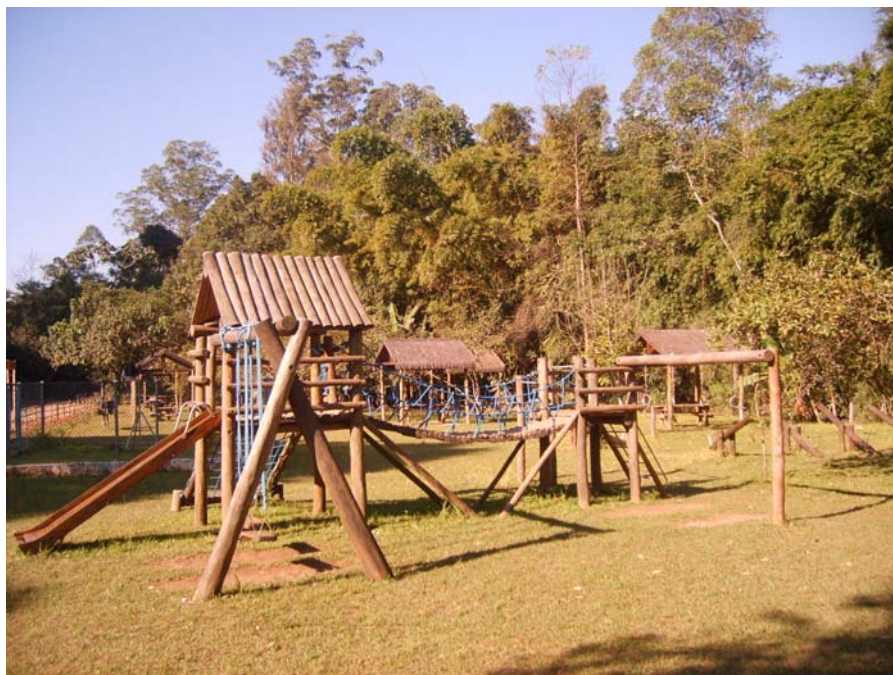
Figura 50 – Playground