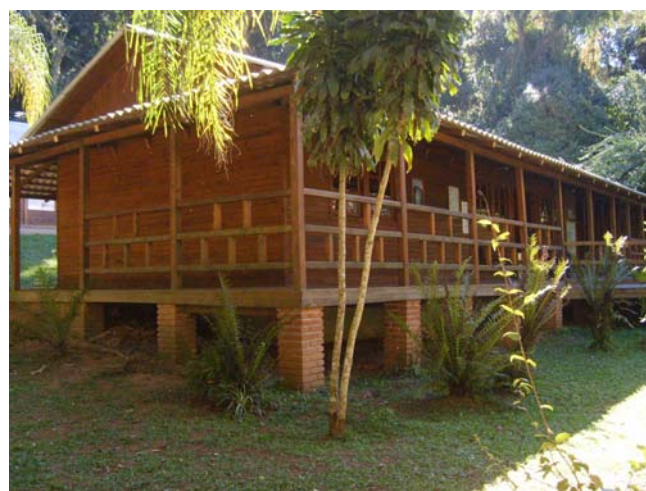
Figura 29 e 30 – Centro de Visitantes