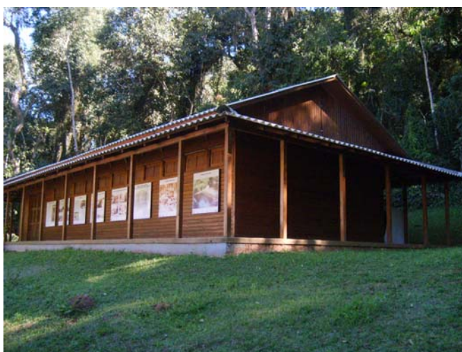
Figura 31 e 32 – Auditório