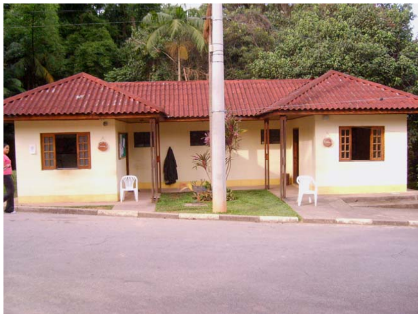
Figura 5 – Setor de Vigilância