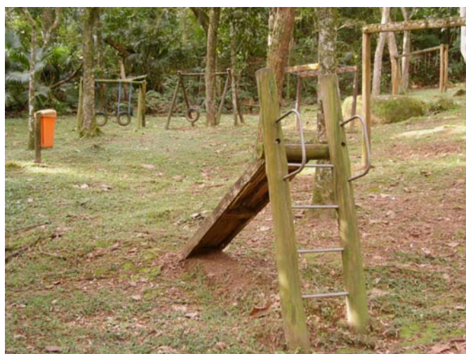
Figura 9 e 10 – Playground