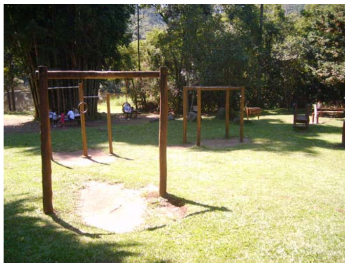
Figura 24 e 25 – Playground