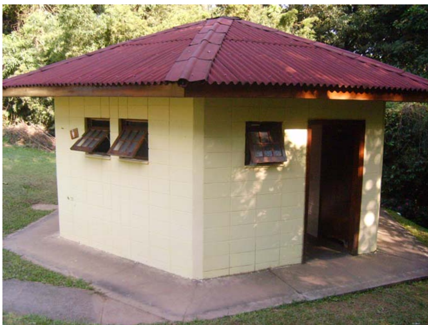
Figura 7 – Sanitário PPG