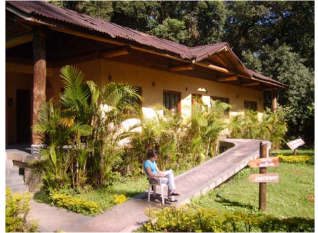
Figura 18 e 19 – Centro de Visitantes