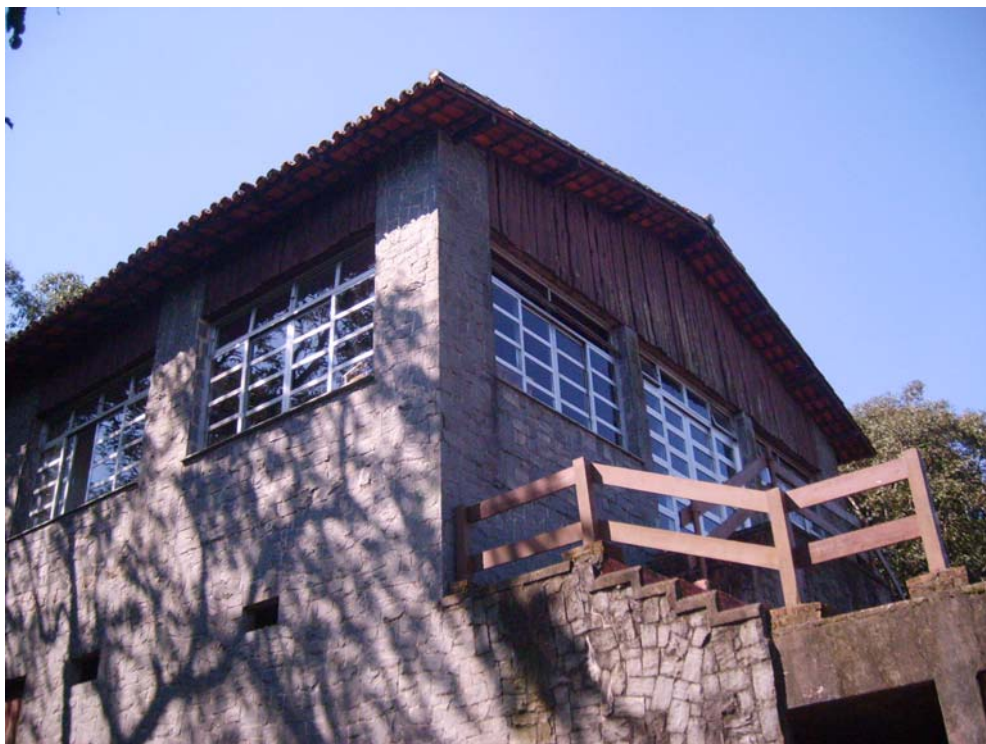
Figura 11 – Museu Pedra Grande