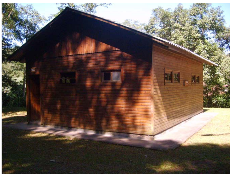
Figura 37 – Sanitários