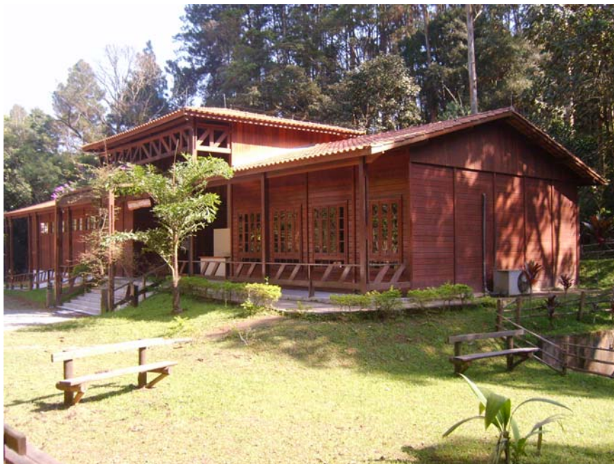
Figura 45 – Centro de Visitantes – Auditório - Museu