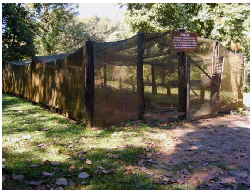
Figura 35 – Viveiro de Mudas