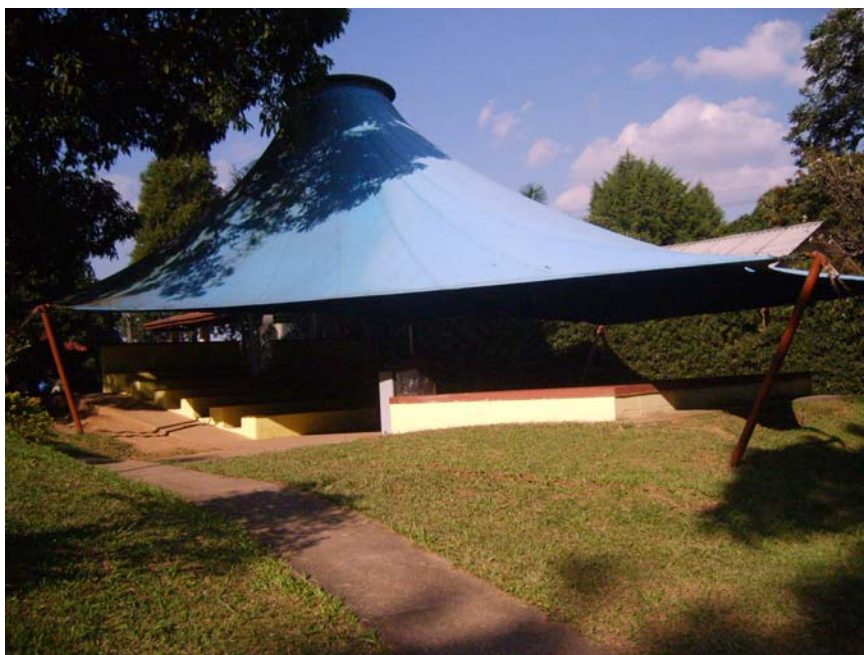
Figura 6 – Tenda