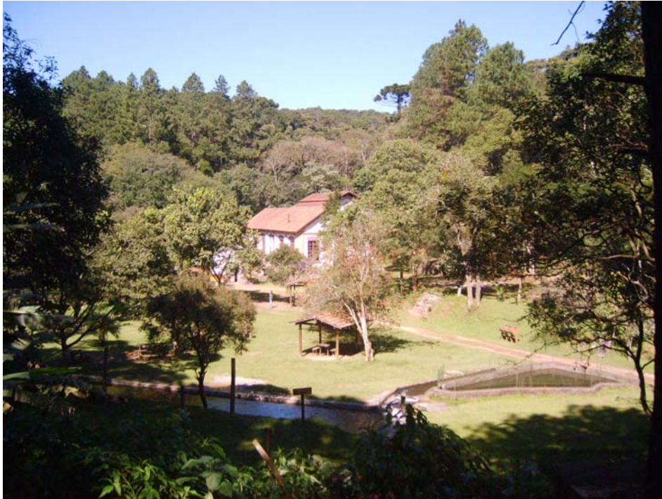
Figura 40 – Vista panorâmica do Recanto das Águas