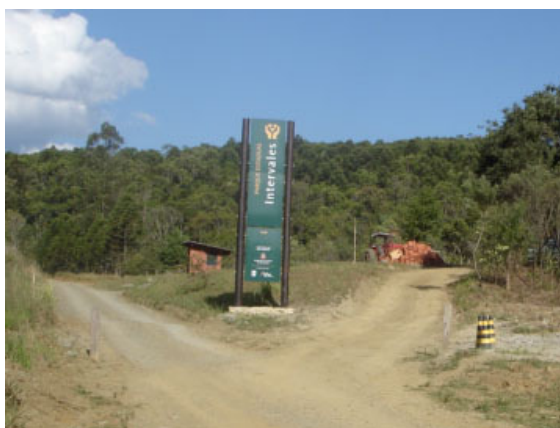
Vista da guarita e totem (entrada por Guapiara). Ao fundo, a casa da zeladoria