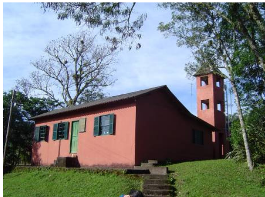
Vista lateral e posterior