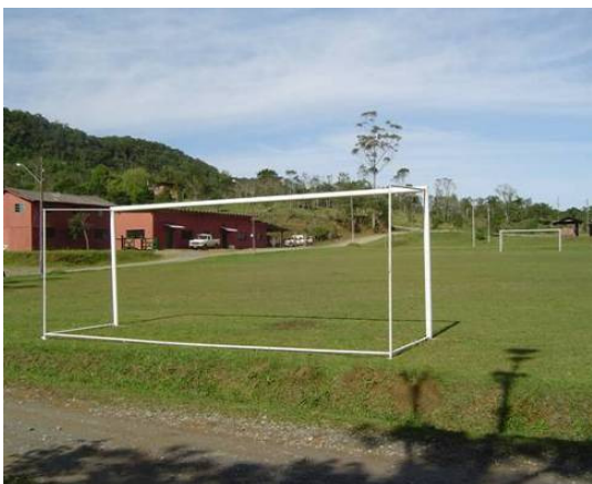
Vista do campo de futebol