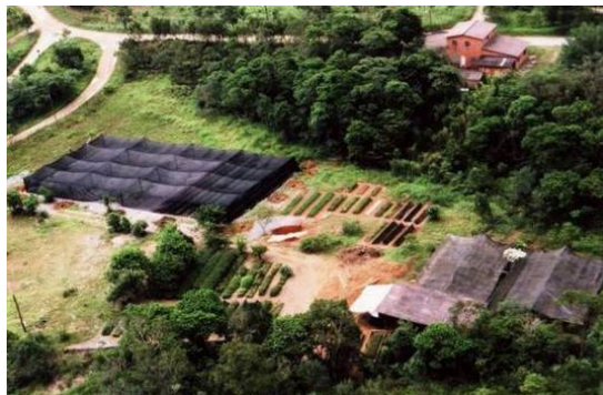
Vista aérea da área do viveiro