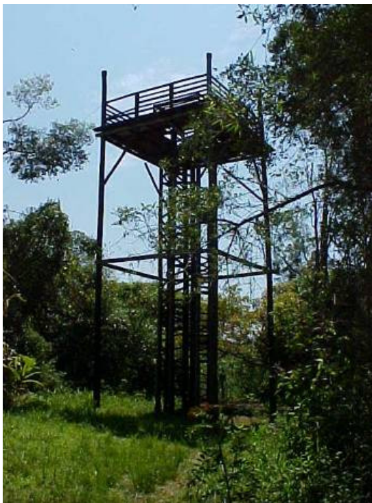
Vista da espia

A espia foi construída na década de 1980 com o objetivo de contemplação da Mata Atlântica e do relevo.