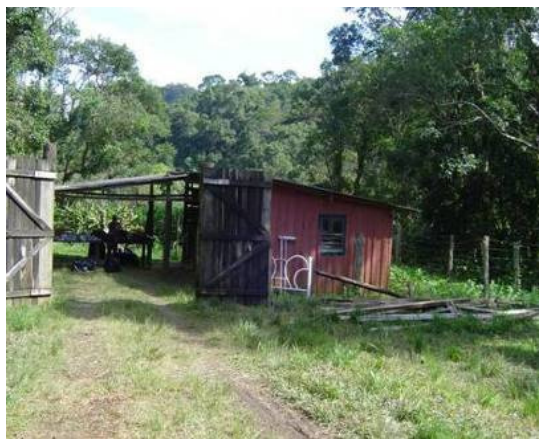
Vista da entrada