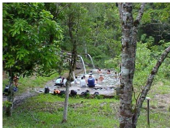
Vista da piscina

Localizada próxima à Monitoria, a Piscina de Pedra é alimentada com água corrente do Lago 1 e é bastante utilizada pelos visitantes regionais e hóspedes.