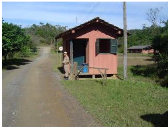
Vista da guarita (entrada por Ribeirão Grande)