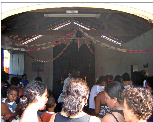
Missã realizada durante a Festa de Sãõ Josã, em Pilões.