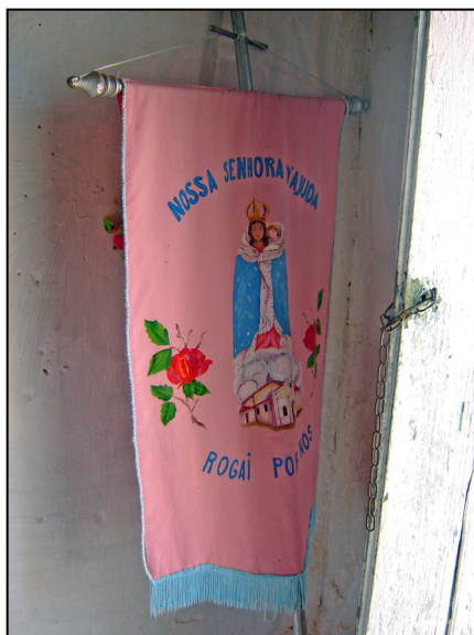
Bandeira da festa de N. Sra. Da Ajuda em Capela do Alto.