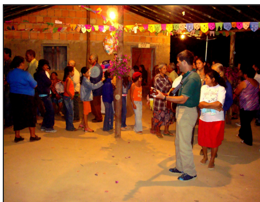
Dança de São Gonçalo – Fileiras de homens e mulheres se sucedem nos turnos da dança.