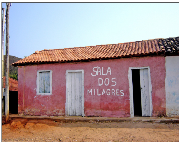
Sala dos Milagres em Capela do Alto.