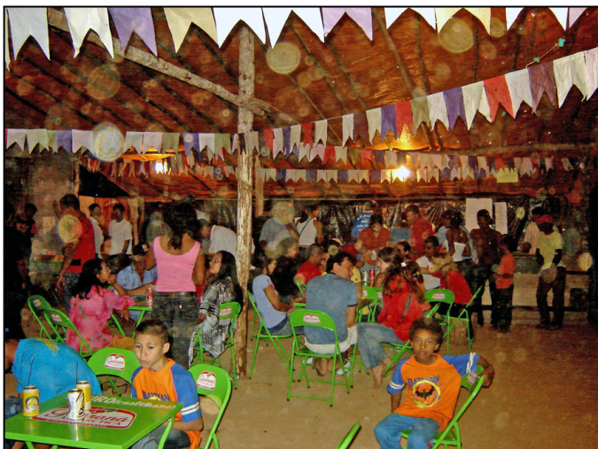
Bingo na Festa de São José em Pilões.