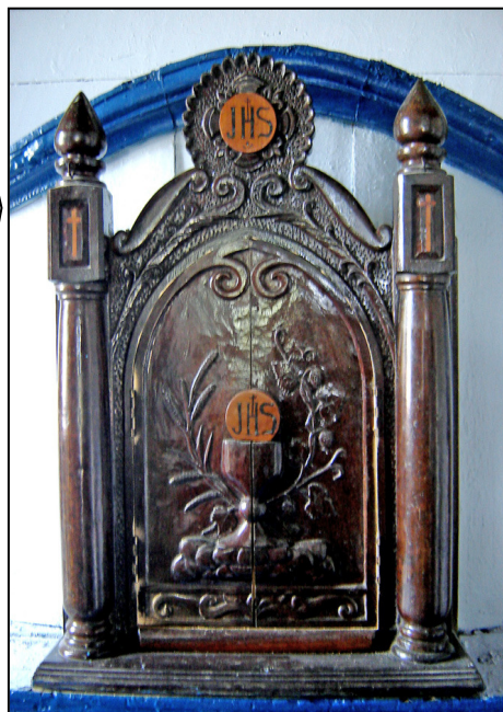
Sacrãrio de origem jesuãta em Iporanga.