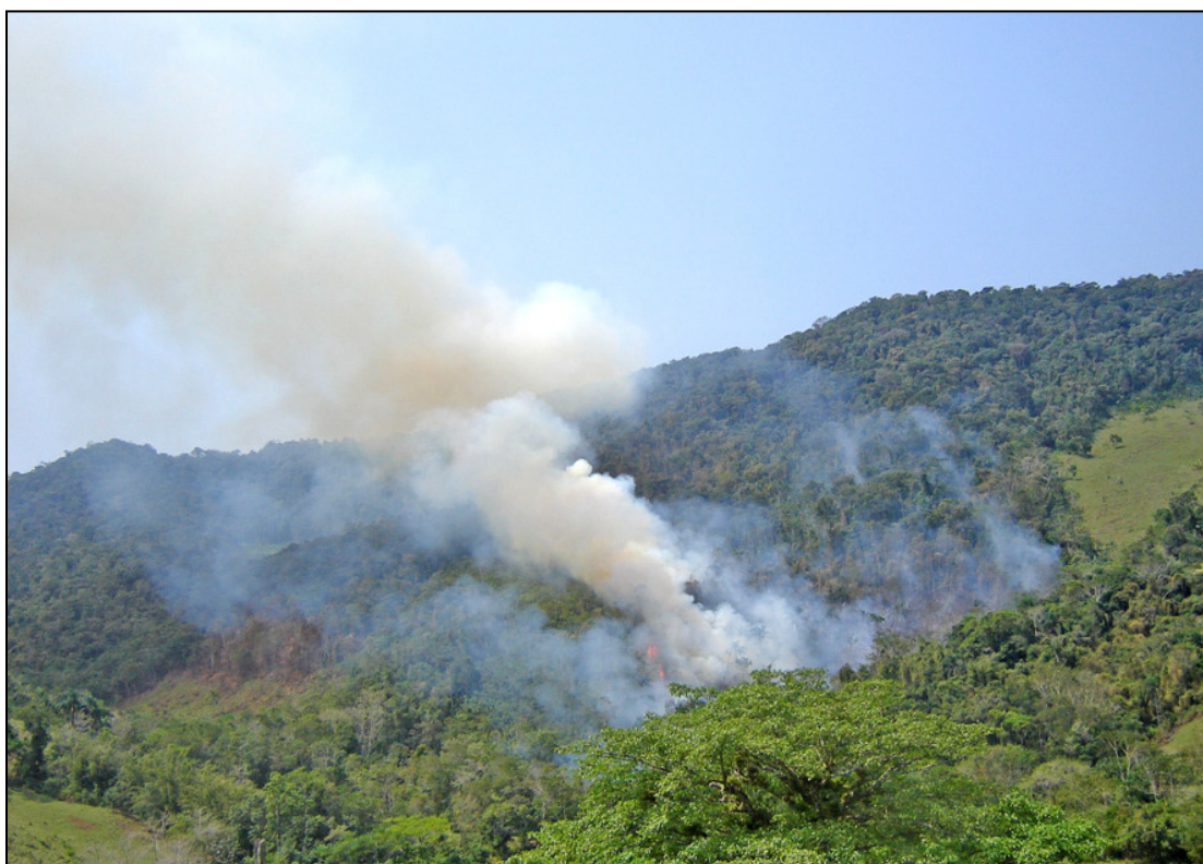
Queima da mata para abertura de áreas de pastagem no entorno das áreas de preservação ambiental.