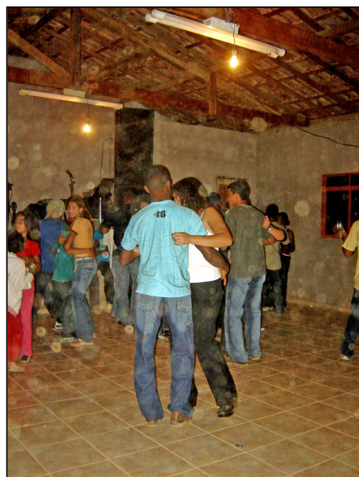
Forró (também chamado de fandango) que encerra a festa de São José em Pilões.