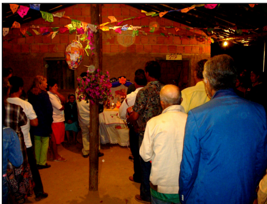
Dança de São Gonçalo - fileiras dos dançarinos em frente ao altar do santo.