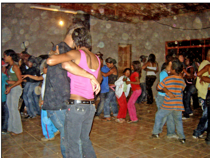
Forró em Pilões.