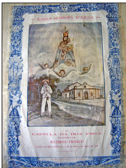
Cartaz alusivo ao achamento da imagem de N. Sra. Da Ajuda padroeira do bairro de Capela do Alto, antigo Capela da Boa Vista.