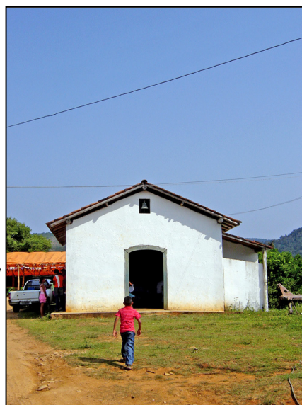
Capela de São José na comunidade quilombola contemporânea de Pilões.