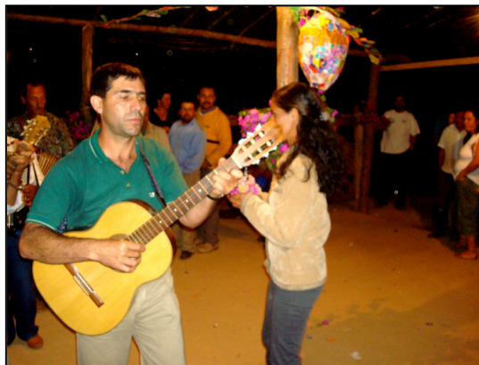
Dança de São Gonçalo – na frente, um dos sanfoneiros.