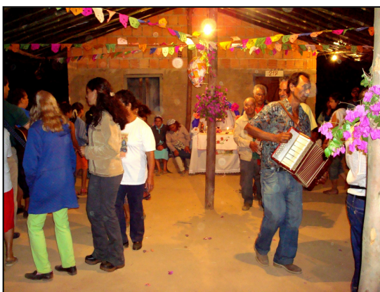
Dança de São Gonçalo – turnos que compõem a dança.