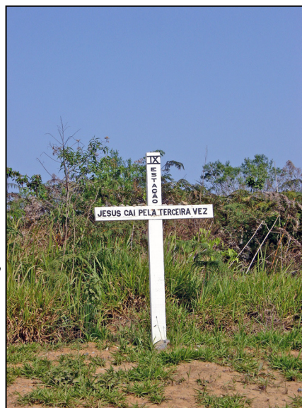
Cruz no roteiro da romaria no bairro de Capela do Alto, as pedras são depositadas sobre a cruz pelos pagadores de promessa.