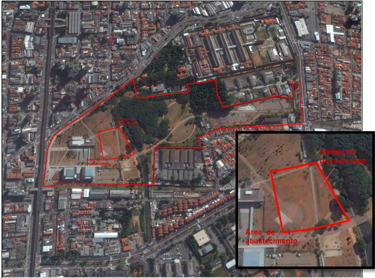
Figura 2 – Indicação da área da Figura 1, com o Parque da Juventude implantado Local de execução de investigação confirmatória.