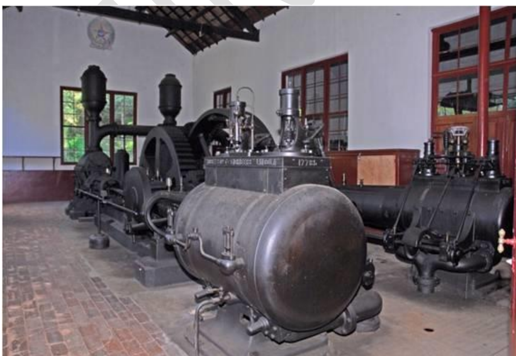
Imagem 12: Bomba a vapor – Casa da Bomba