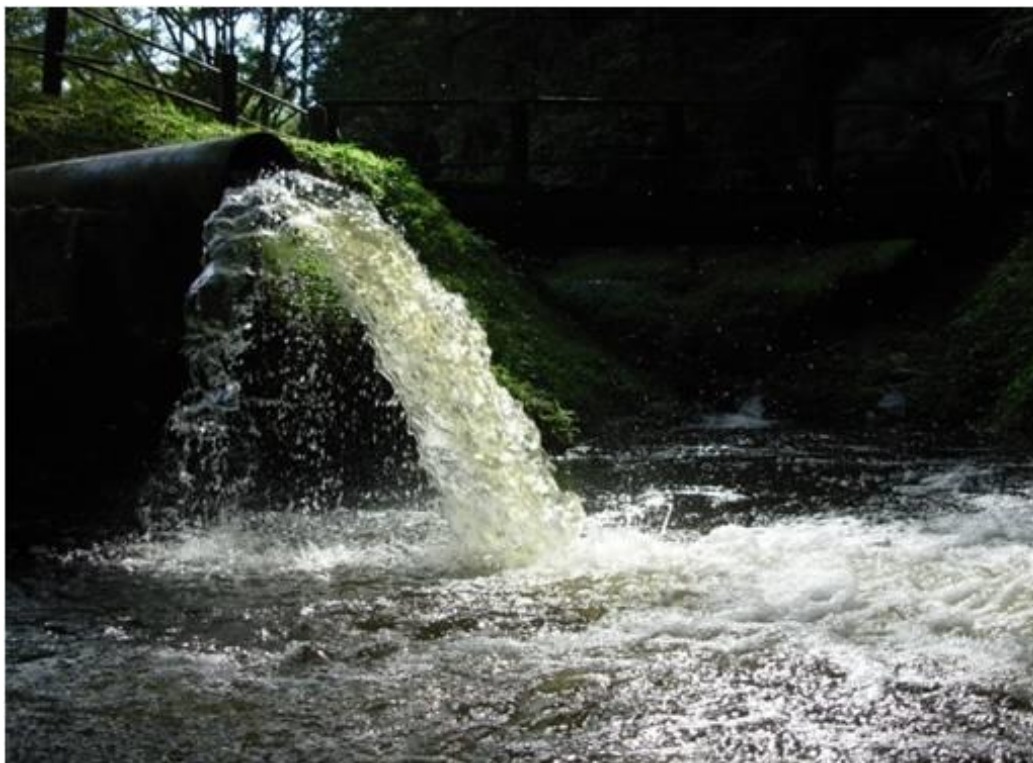
Imagem 16: Ducha do Guarú