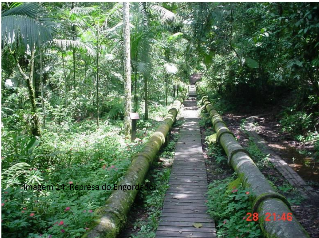
Imagem 14: Represa do Engordador