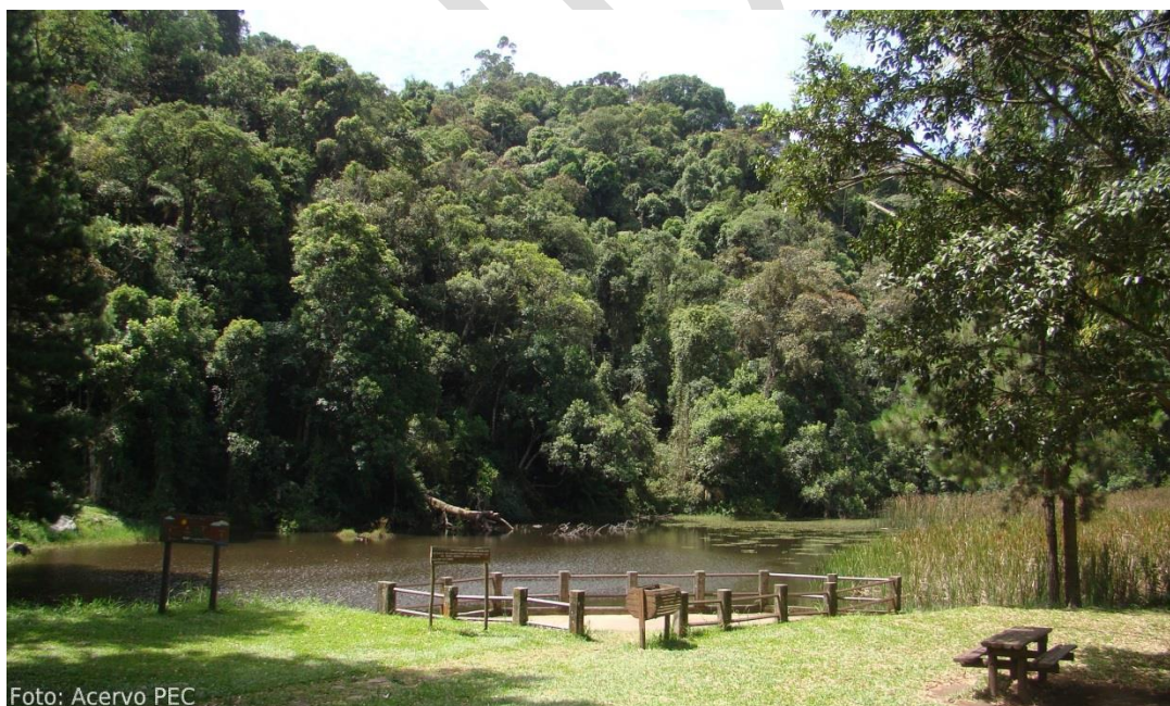
Imagem 6: Centro de Visitantes