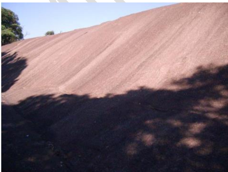
Imagem 3: Pedra Grande