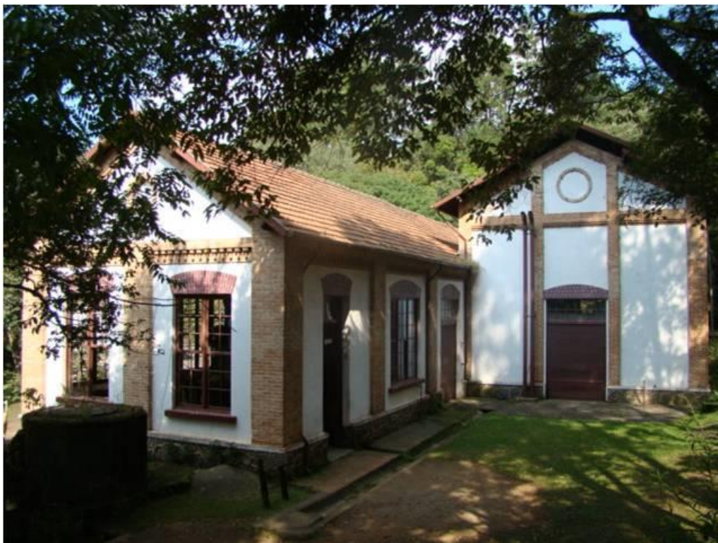
Imagem 11: Casa da Bomba