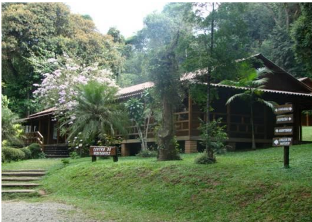
Imagem 13: Centro de Visitantes