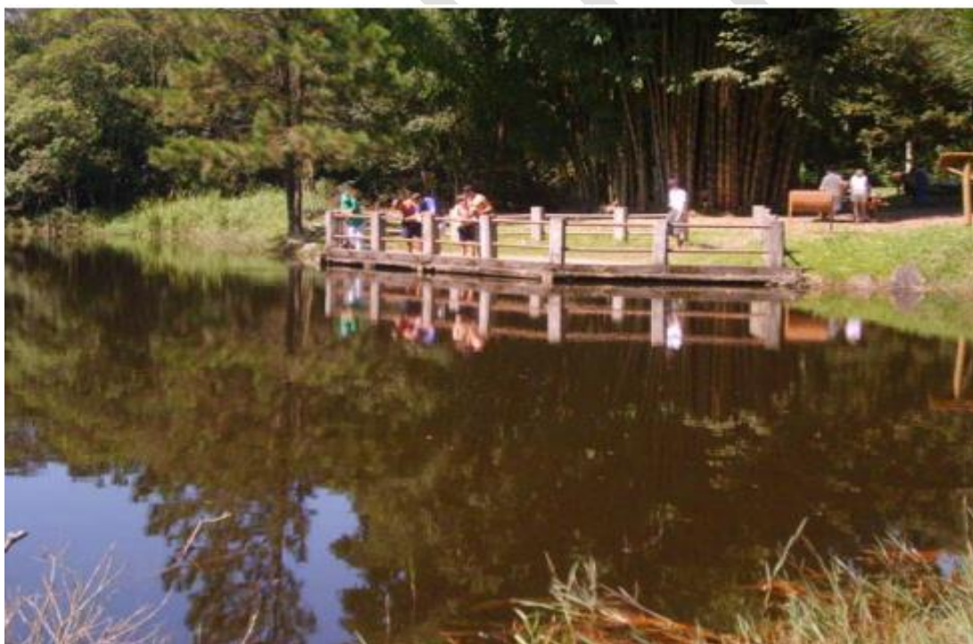
Imagem 9: Mirante do Lago