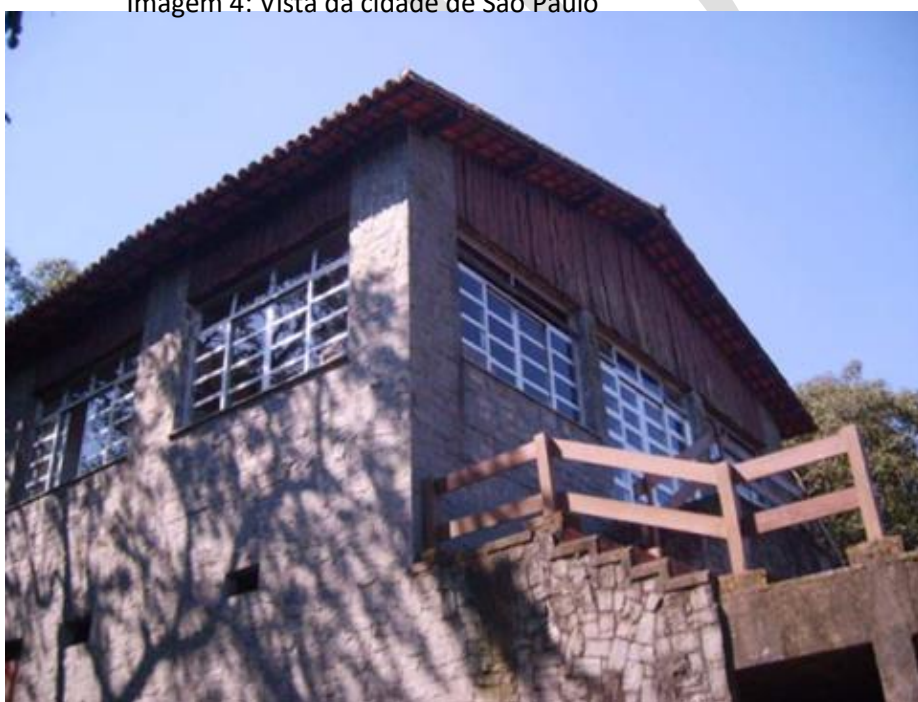
Imagem 5: Museu da Pedra Grande