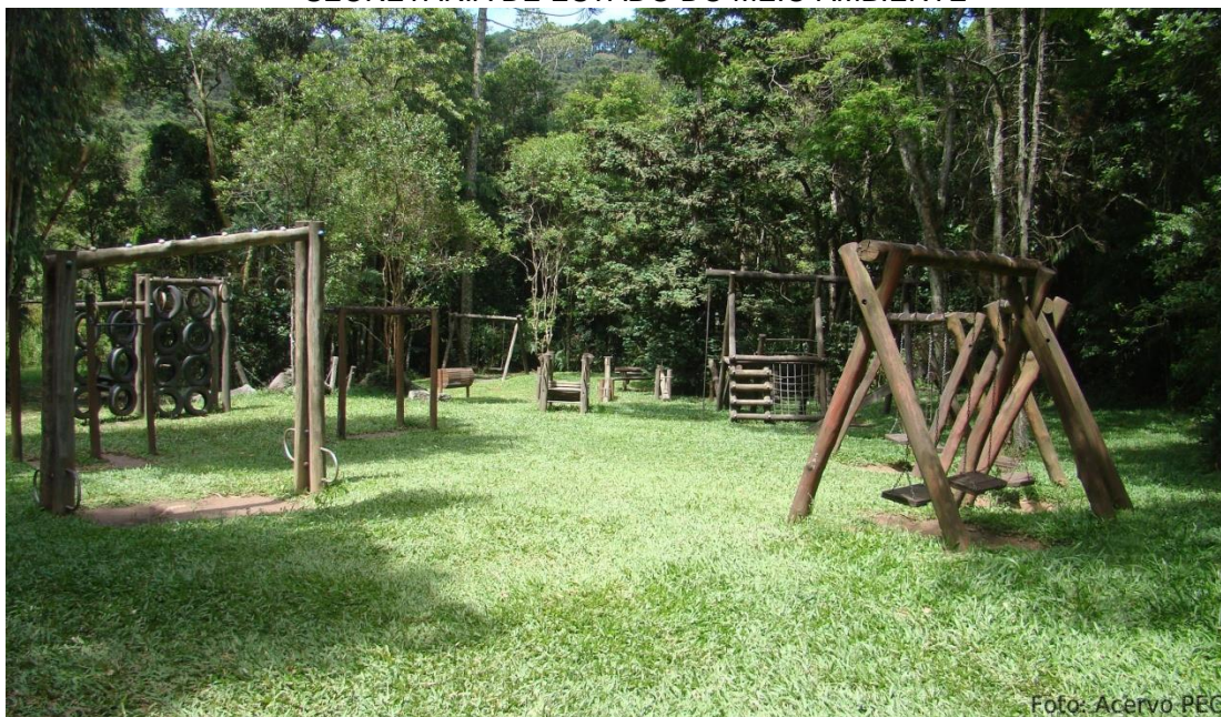
Imagem 8: Playground do Lago das Carpas