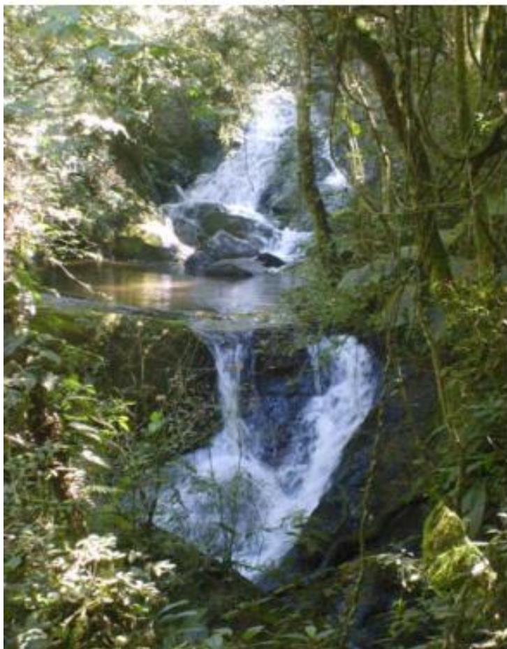
Imagem 17: Cachoeira