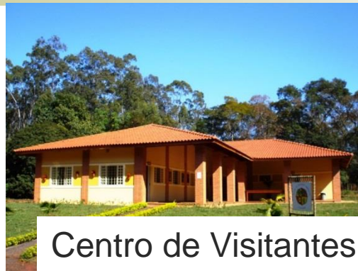
Centro de Visitantes