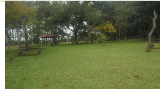
Área de lazer/parque/quiosques