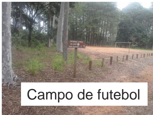
Campo de futebol